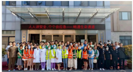
为提升全院职工的安全意识,防范安全风险,8月23日,无锡市口腔医院成功举办2024年安全生产月系列活动。

此次活动以“人人讲安全、个个会应急”为主题,开展了安全知识讲座、应急演练、安全知识竞赛等多种形式的活动。专家们结合丰富的理论知识,对安全生产的重要性、风险防范意识、应急处置流程等方面进行了详细讲解。同时,还就如何提升全员的安全意识和应急能力进行了交流。会议通过理论与实践相结合的方式,为参会人员提供了宝贵的学习机会,有效提升了全员的安全意识和应急能力。